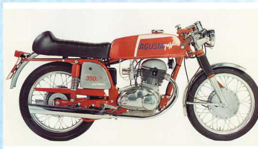
MV 350 Sport "B" Elettronica - 1972

La Sport si evolve stilisticamente e meccanicamente. La linea è più slanciata grazie al nuovo serbatoio ed ai fianchetti di maggiori dimensioni. Il propulsore riceve in dotazione una importante modifica nell'impianto di accensione, adesso dotato di accensione elettronica. La colorazione è rossa. Per aumentare il look racing viene allestita una serie ancora più sportiva, dotata di carenatura completa come nelle moto da Gran Prix.