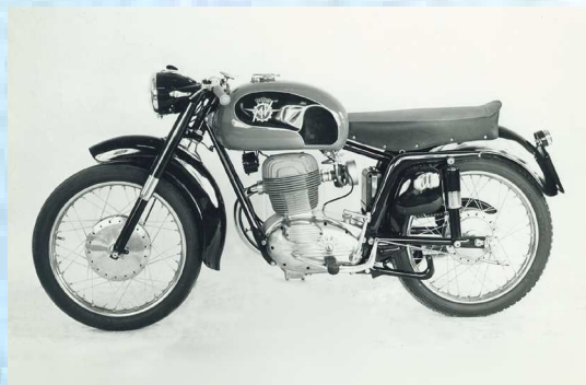
MV 175 Turismo CSGT - 1957

Velocità massima: 100 Km/h Consumo: 34 Km/l