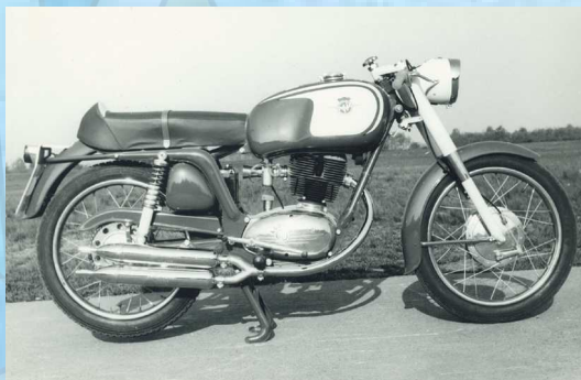
MV 150 Sport "RS" - 1963

Cilindri/tempi: mono/ 4T Cilindrata: 150.1 cc Alesaggio x corsa: 59.5x 54 mm Rapporto di compressione: 7:1 Potenza/giri: 9 CV/ 6000 Coppia/giri: N.D. Raffreddamento: aria Distribuzione: aste e bilancieri Alimentazione: carburatore 20 mm Accensione: volano-magnete Lubrificazione: carter umido Avviamento: pedivella Trasmissione primaria: ingranaggi Frizione: multidisco in bagno d'olio Cambio: 4 marce e, dal 1966, a 5 marce Trasmissione secondaria: catena