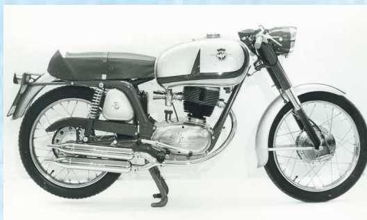
MV 150 Sport "RS" - 1967

Velocità massima: 115 Km/h Consumo: 34 Km/l