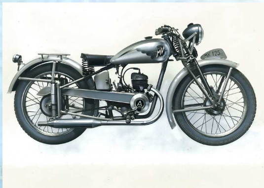
MV 125 Turismo (3 Velocità) - 1948

La 125 rappresenta la logica evoluzione della 98 presentata due anni prima ed è dotata di prestazioni più interessanti. Resta l'impostazione utilitaria del mezzo, adatto ad un pubblico che in questi anni è alla ricerca di una moto economica. Questa 125 è un modello di transizione, sarà sostituita da una nuova ottavo di litro profondamente modificata.