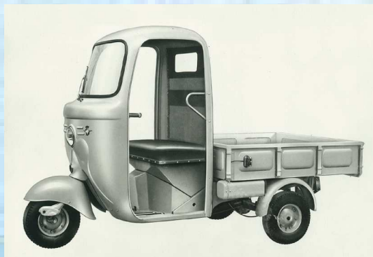
MV 150 Motocarro Centauro RF - 1958

Il Centauro è il terzo veicolo da trasporto. Rispetto ai modelli precedenti cambia tutto: adesso la struttura prevede una cabina anteriore per alloggiare il guidatore. Il cassone è posteriore, metallico. Il motore è a 4 tempi, derivato dal 125 Turismo Rapido (1954) con aggiunta della pompa di lubrificazione a ingranaggi e ventola di raffreddamento.