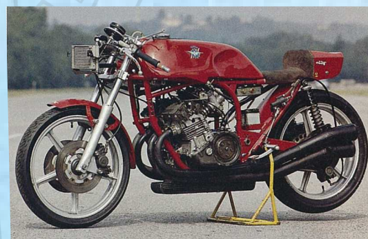
MV 350 4 cilindri - Versione 1974