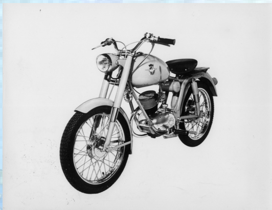
MV 50 Liberty Turismo 16" - 1962

Velocità massima: 40 Km/h Consumo: 65 Km/l